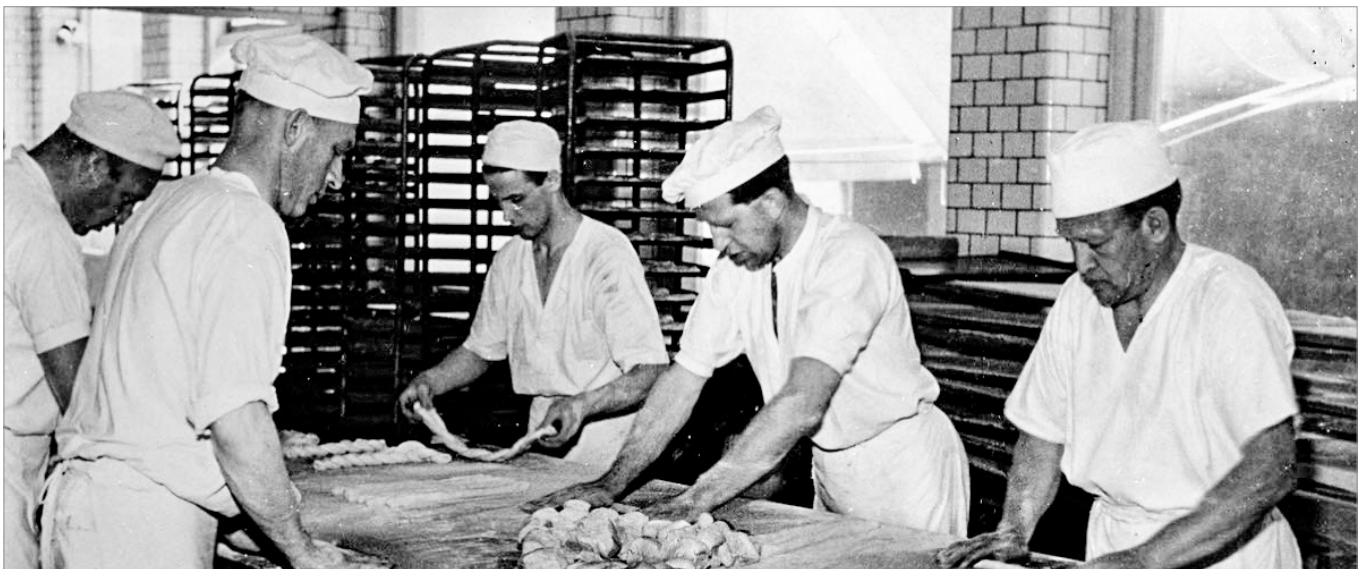
Bageriarbetare på den gamla goda tiden.

På 1970-talet accelererade denna utflyttning och övergick samtidigt till åretruntboende. Sportstugor byggdes om, nedlagda jordbruksfastigheter köptes upp, och äldre grusvägar asfalterades. Allt fler människor började pendla till jobbet, mest med bil men från 1980 även med pendeltågen mellan Alingsås och Göteborg. Ett slags urbanisering av landsbygden in-